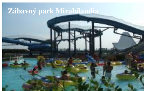
Zábavný park Mirabilandia