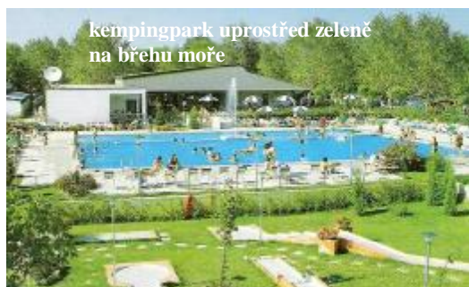
kempingpark uprostřed zeleně na břehu moře